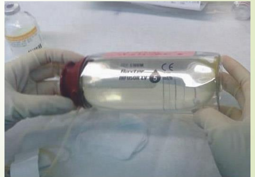
攜帶式輸液器 (化療奶瓶)