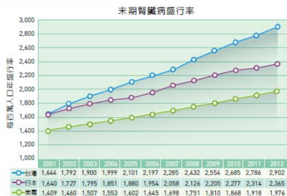
圖二 末期腎臟病盛行率