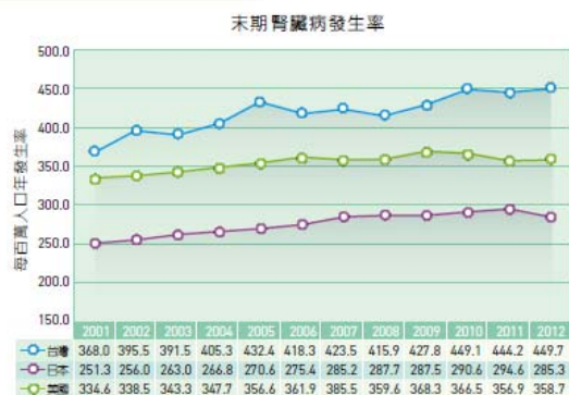
圖一 末期腎臟病發生率