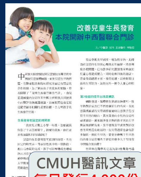
CMUH醫訊文章 每月發行4,000份