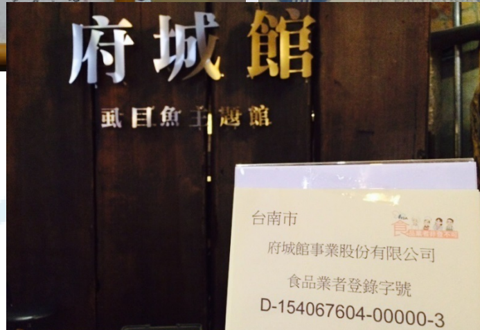
府城館事業股份 有限公司 45